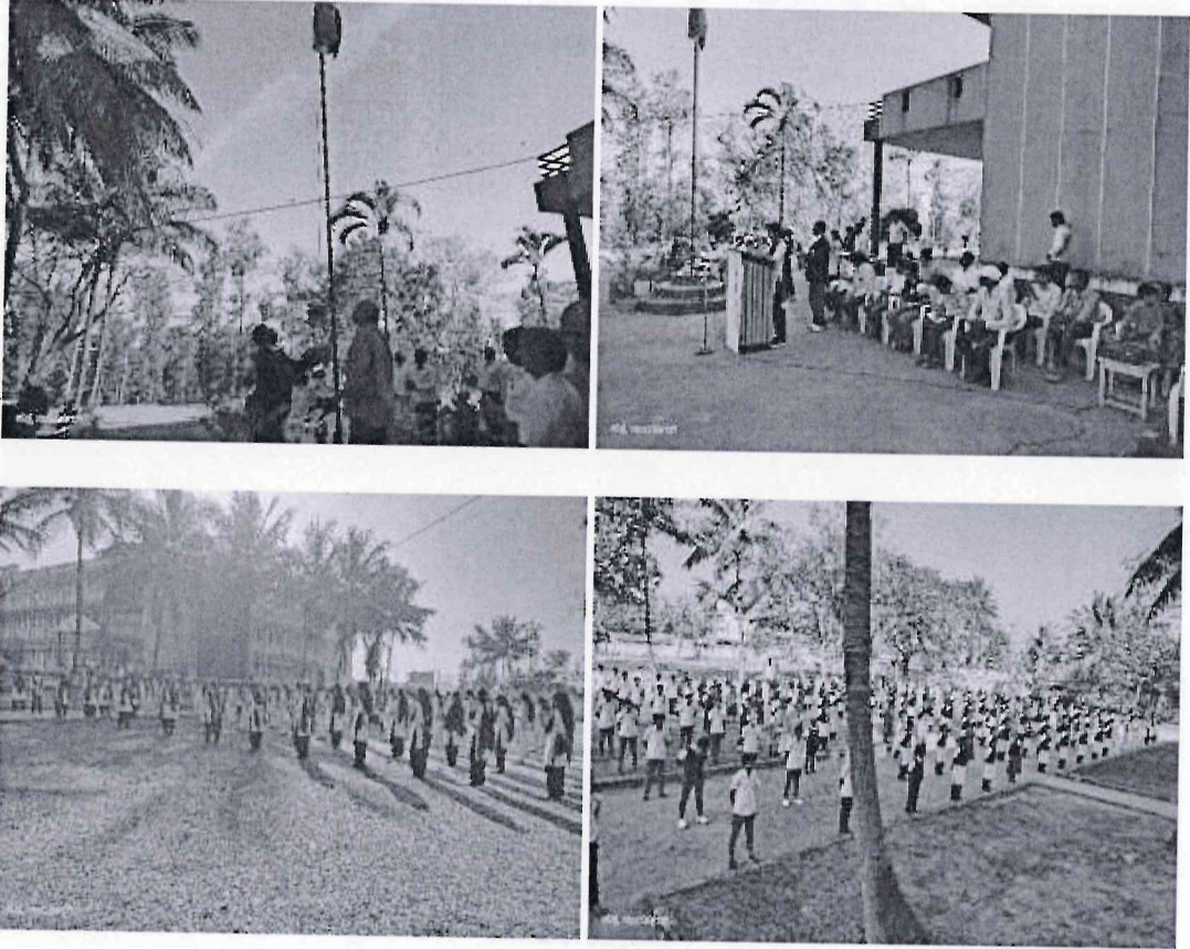
ಸಕಲೇಶಪುರ ಜಿಎಸ್‌ಎಸ್ ಶಿಕ್ಷಣ ಸಂಸ್ಥೆಯಲ್ಲಿ ದಿನಾಂಕ 26-01-2023 ರ ಗುರುವಾರ ಗಣರಾಜ್ಯೋತ್ಸವ ದಿನವನ್ನು ಸಂಭ್ರಮದಿಂದ ಆಚರಿಸಲಾಯಿತು.